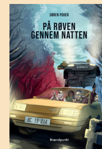
På røven gennem natten (Brændpunkt, 4. september 2020)