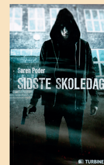
Sidste skoledag (Turbine, 11. september 2015)